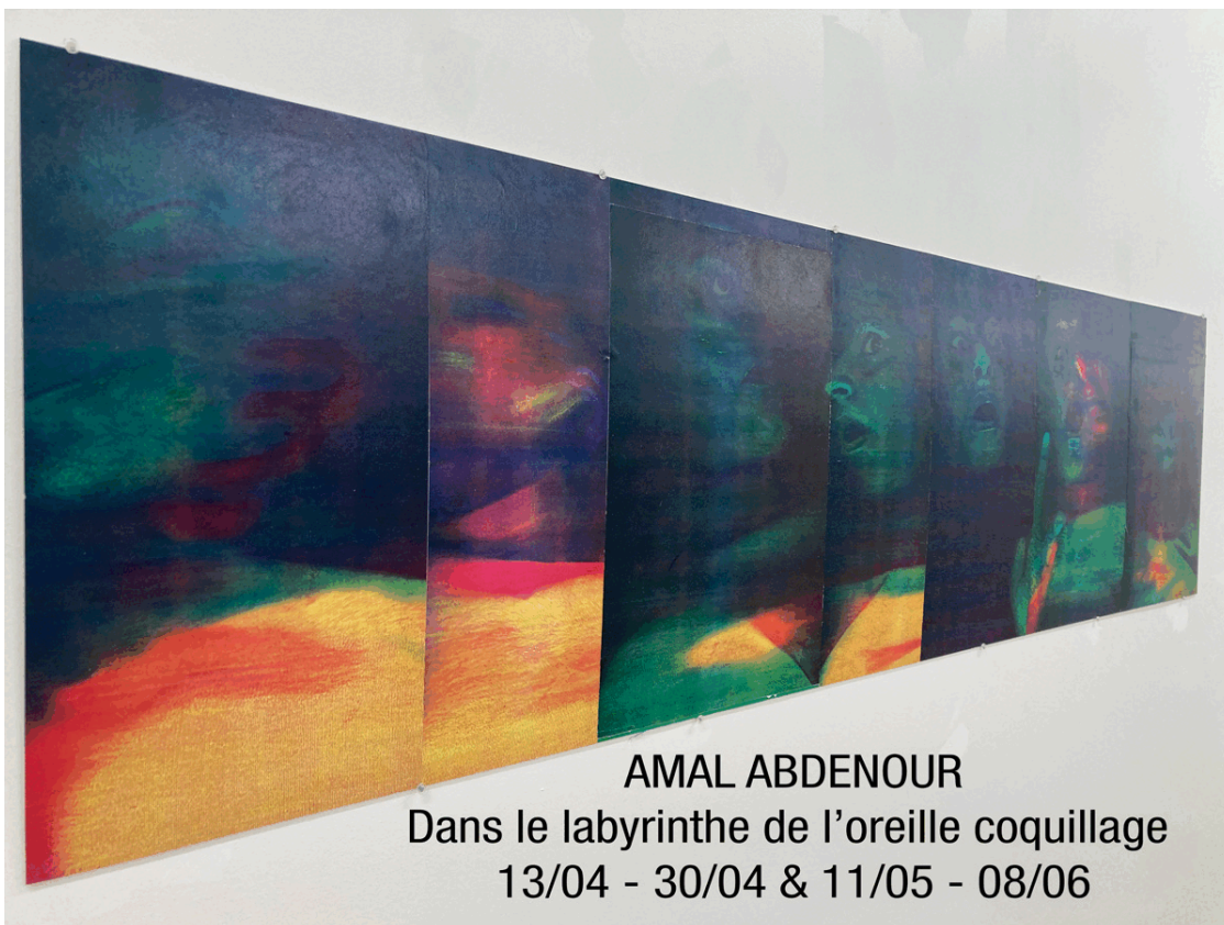
AMAL ABDENOUR Dans le labyrinthe de l'oreille coquillage 13/04 - 30/04 & 11/05 - 08/06

Enseigne des Oudin ferme le 1er mai 2024 RÉOUVERTURE LE 11 MAI 2024 15H