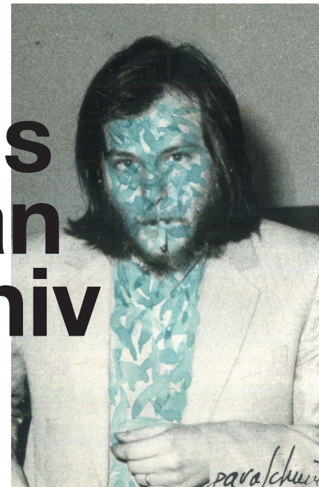
Autoportrait bleu, 1979, aquarelle sur photo (9 x 6,5 cm)

Christian Paraschiv incarne nombre de contradictions de la seconde moitié du XX e siècle. Peintre reconnu en Roumanie, il ne pouvait travailler qu'au prix de contorsions avec le régime de Ceaucescu. Exilé en France en 1986, la liberté acquise s'est exprimée dans la série Le Noir est la couleur du langage, mettant l'accent sur le dépaysement, mais sans traduire sa révolte politique, qui était pourtant à l'origine de son départ. Son exil fut à contretemps ; trois ans à peine après son départ de Roumanie, le régime honni chutait. Les artistes restés devinrent des symboles de résistance, à la fois témoins du passé et porteurs d'une liberté à inventer.